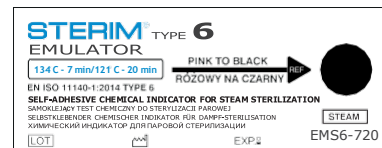
Po ukončení správně provedené sterilizace