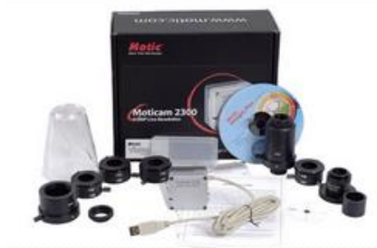
Digitální kamera kat. č. AC17454

Základní cena (binokulární mikroskop + 3x objektiv) na vyžádání.