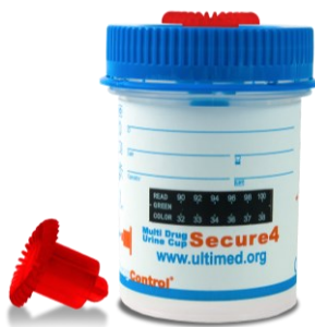
Obrázek se může lišit od originálu.

Barevná linka se objeví vždy v kontrolní oblasti testu (C). To je potvrzení, že byl použit správný objem vzorku, technika provedení byla správná a membrána proužku měla dostatečnou nasákavost.